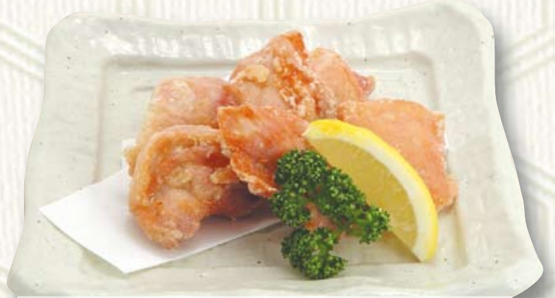
鶏の唐揚げ 580円(税抜き)