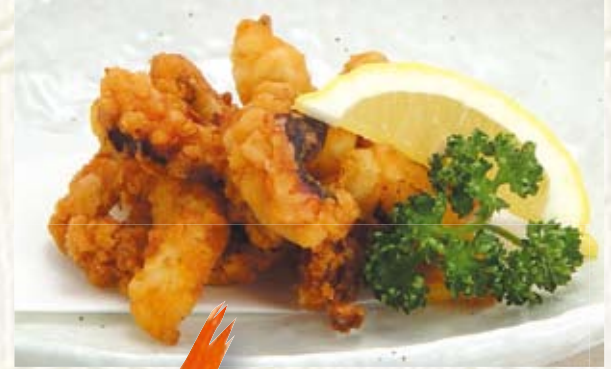
蛸の唐揚げ 480円(税抜き)