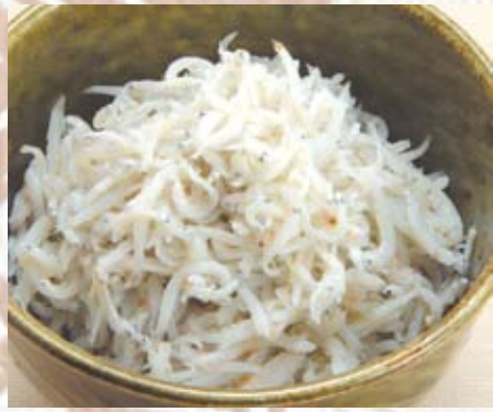
しらす卸し 380円(税抜き)