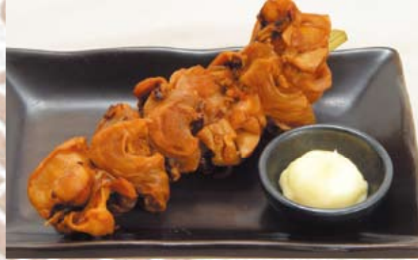
烏賊軟骨串 380円(税抜き)