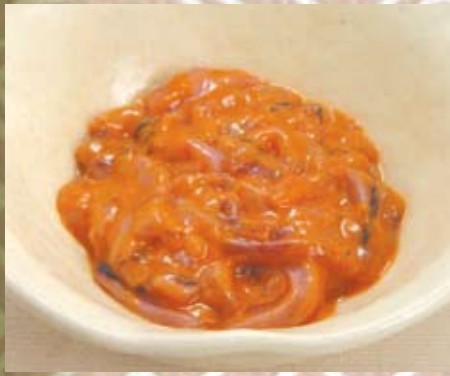
烏賊の塩辛 180円(税抜き)