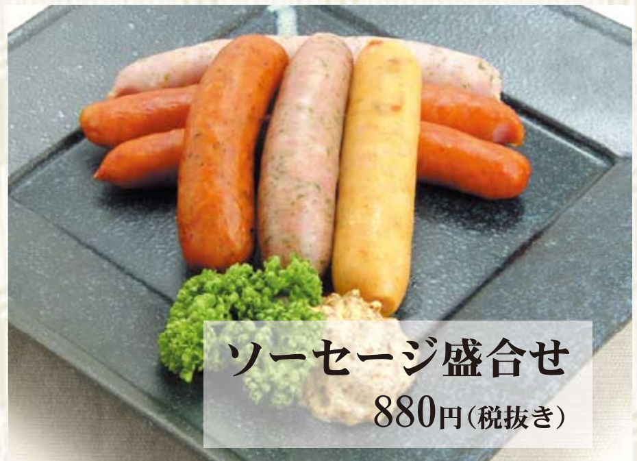
ソーセージ盛合せ 880円(税抜き)