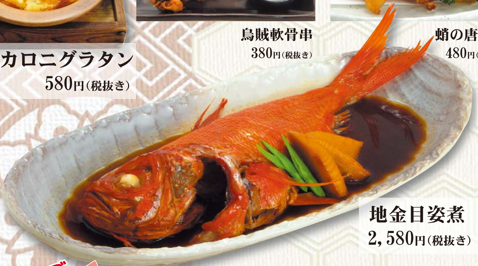
地金目姿煮 2,580円(税抜き)