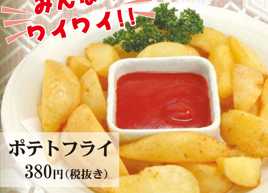
ポテトフライ 380円(税抜き)