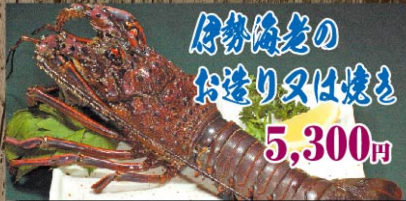
伊勢海老の お造り又は焼き 5,300円