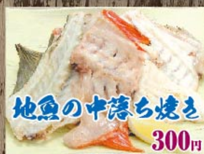
地魚の中落ち焼き 300円