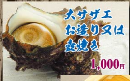
大サザエ お造り又は 壺焼き 1,000円