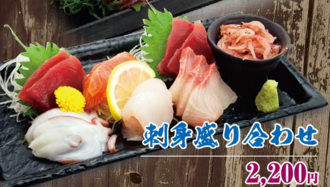
刺身盛り合わせ 2,200円