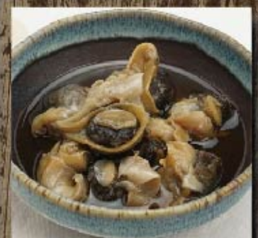
つぶ貝の うま煮 800円