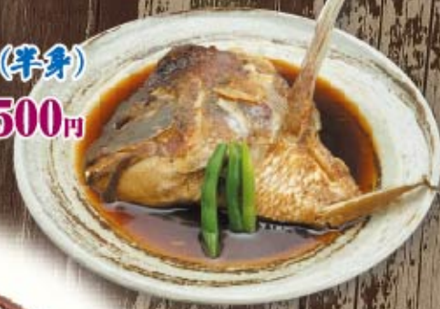
本日の究煮 (半身) 500円