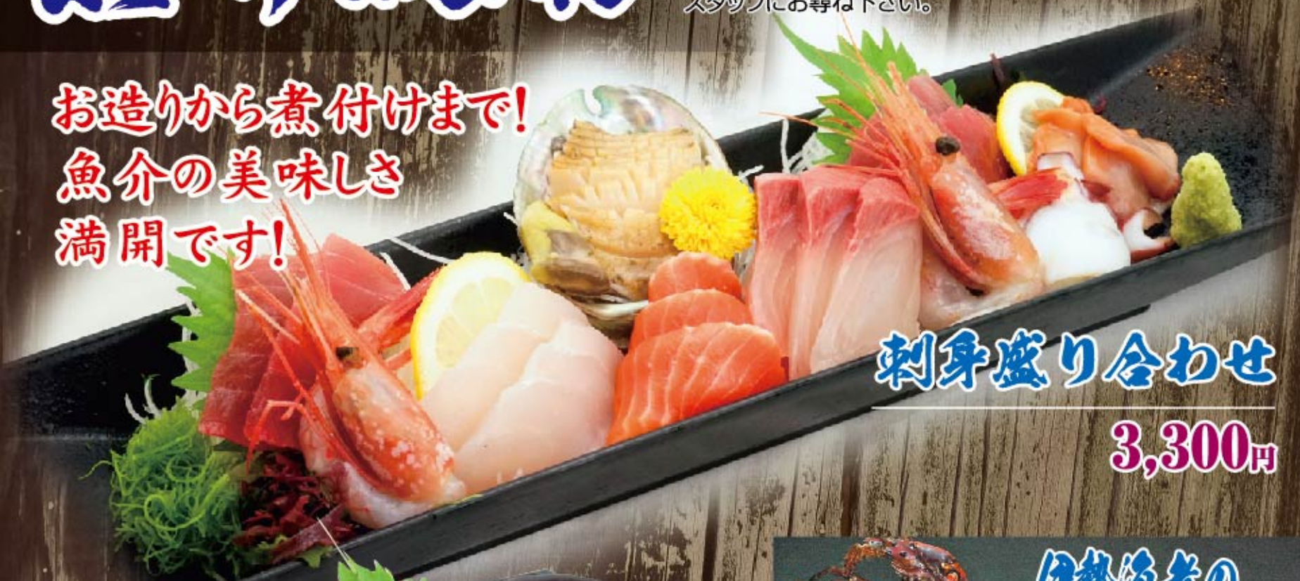
刺身盛り合わせ 3,300円